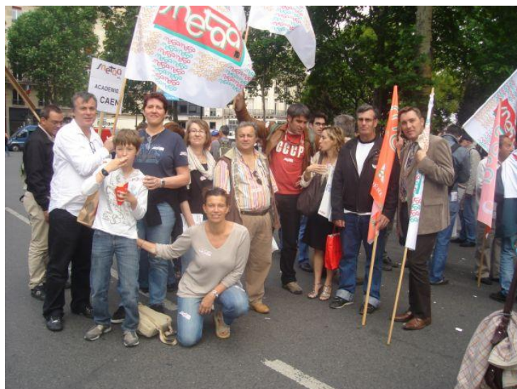
Les camarades de Paris