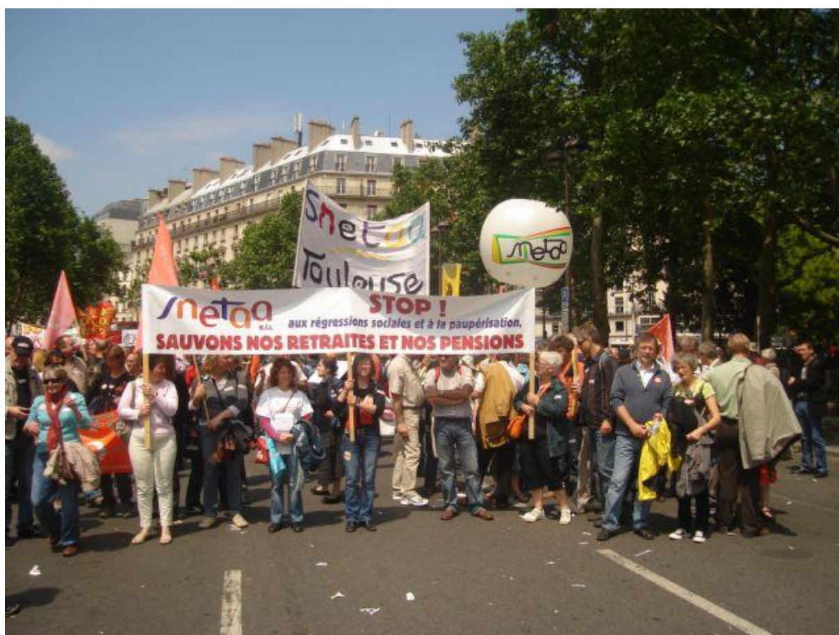
Le SNETAA : place de la République